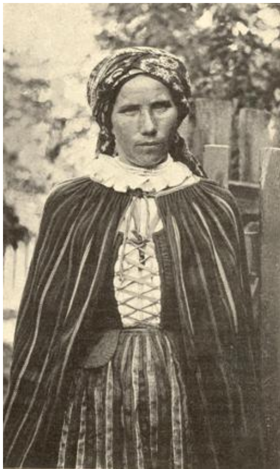
Polesunka z okolic Mińska Mazowieckiego.

Różnice między Łurzycokami i Polesokami miały także podłoże czysto praktyczne, związane z warunkami hydrologicznymi i specyfiką życia. Stałym elementem bytowania nad Wisłą były bowiem sezonowe wezbrania wody: wiosenne, zwane krakówkami lub marcówkami, czerwcowe – zwane janówkami oraz lipcowe – nazywane jakubówkami. Szczególnie niebezpieczne były ponadto zimowe powodzie zatorowe, spowodowane zablokowaniem koryta rzeki sryżem lub lodem. Specyfikę bytowania nad Wisłą znakomicie oddaje powszechnie znana przyspiewka, w której słychać zarówno chęć podkreślenia bogactwa Łurzyca, jak też nutę zawodu wobec ciągłego zagrożenia ze strony nieobliczalnej rzeki: